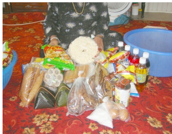
B. Isi kandungan duang