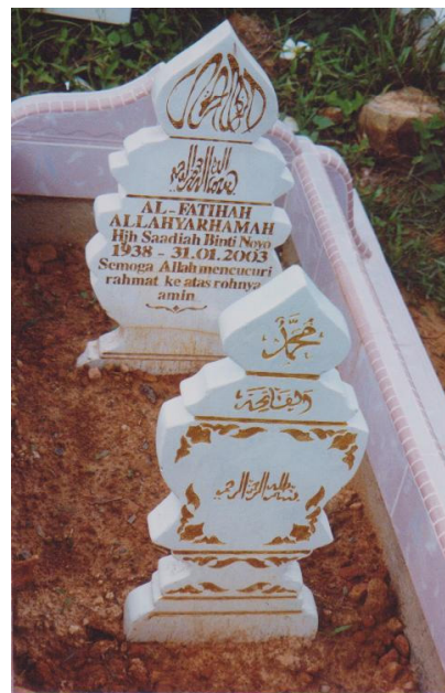
E: Kubur wanita Bajau