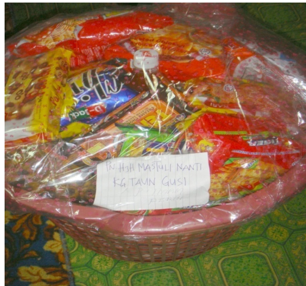
A. Duang moden

Kota Belud yang telah menggantikan duang dengan sedekah berupa wang ringgit dan keperluan ibadah yang lain seperti naskhah Al-Quran dan surah Yassin, kain pelikat atau sarung, telekung, tudung, songkok atau kopiah, sejadah dan seumpamanya. Ini kerana amalan membuat duang menagih masa, tenaga dan wang ringgit yang bukan sedikit nilainya. Dalam dunia moden yang semakin kompleks, ramai orang Bajau sudah bekerja, tidak kira lelaki dan wanita dan ini menyebabkan amalan ngeduang dibuat dengan ala kadar atau sekadar mampu sahaja.