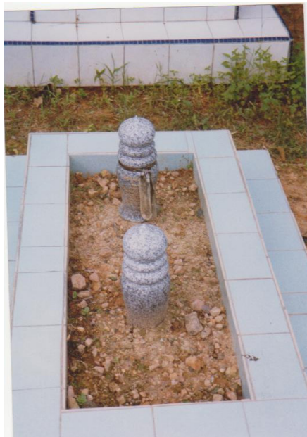
F: Kubur lelaki Bajau