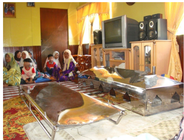
D: Sangkab-sangkab yang telah dipermodenkan, iaitu diperbuat daripada besi yang kekal lama.

barangan keperluan diri, peralatan tidur serta peralatan dapur kepada saguhati berbentuk wang ringgit. Namun, sedekah berbentuk peralatan ibadah seperti telekung, sejadah, kain dan juga beras yang dianggap sebagai kiparat badan masih diamalkan sehingga penelitian ini dilaksanakan. Demikian juga halnya dengan penggunaan payung dan kelambu orang mati yang masih lagi relevan sebagai simbol kematian. Di samping itu, batu nisan sebagai lambang kematian yang dulunya hanya terdiri daripada bongkah-bongkah batu kini telah dibentuk menjadi lebih menarik bergantung kepada kemampuan keluarga si mati seperti contoh dalam gambar E dan F.