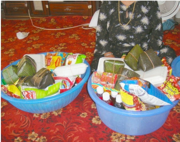
C. Isi kandungan duang Bajau pada masa kini (semasa kajian lapangan dilaksanakan), yang telah dipermodenkan dengan tambahan beberapa sajian seperti minuman botol, makanan dalam tin, makanan ringan seperti keropok, biskut dan sebagainya.