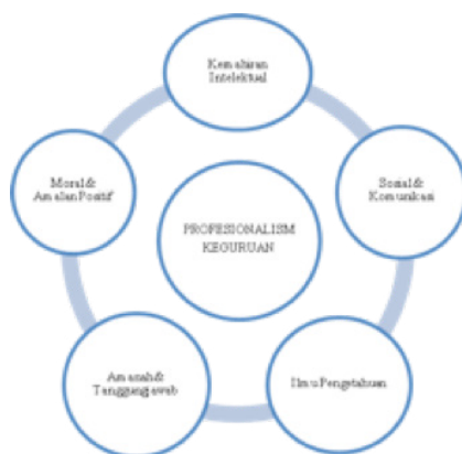
RAJAH 1. Kerangka Konseptual Pencapaian Profesionalisme Keguruan