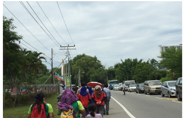
GAMBAR 1. Program Harmony Visit , 25 Ogos 2018 di Bukit Padang, Kota Kinabalu, Sabah