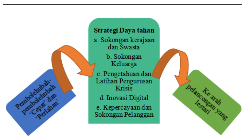
RAJAH 2. Cadangan Rangka Kerja Ketahanan Pelancongan ( community-based tourism resilience framework, CTRF ) secara holistik berasaskan komuniti untuk usaha niaga CBT

kerja yang dicadangkan mempunyai sokongan yang kukuh daripada kajian terdahulu. Setakat ini, kajian ini memberikan sumbangan penting kepada badan pengetahuan sedia ada dalam bidang CBT dan menekankan isu daya tahan sebagai salah satu komponen penting untuk pelancongan lestari. Namun begitu, pengkaji akan mencadangkan untuk menguji kebolegunaan rangka kerja yang dicadangkan kepada destinasi yang memberi tumpuan kepada program CBT oleh penyelidik pada masa akan datang.