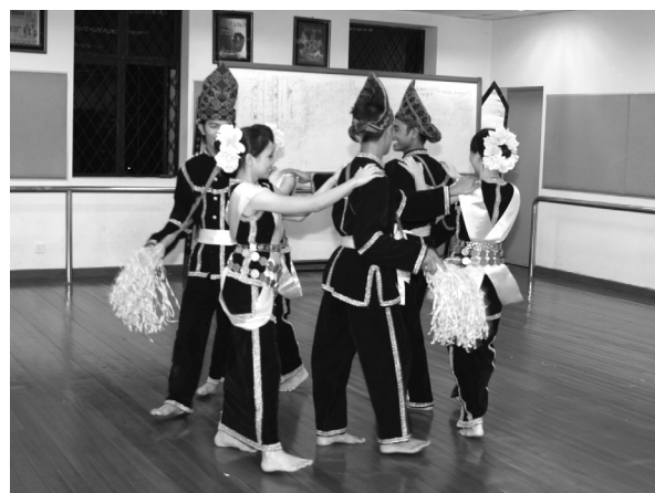
GAMBAR 2. Pola Lantai Sumazau Penampang Berbentuk Bulatan Secara Berselang-seli di Antara Penari Lelaki dan Penari Wanita