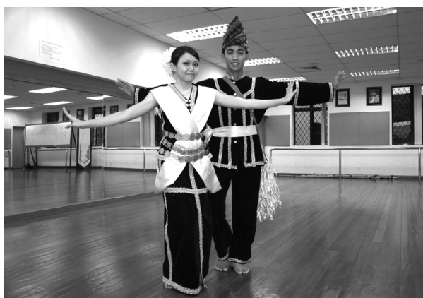
GAMBAR 1. Gaya Mengambai Sumazau yang Menyerupai Burung Layang-Layang

Pada masa ini, tarian rakyat popular etnik Kadazan di Daerah Penampang dikenali sebagai Sumazau Penampang, di Daerah Kecil Membakut dikenali sebagai Sumazau Paina Membakut dan di Daerah Papar dikenali sebagai Sazau Papar. Jika diteliti, ketiga-tiga jenis tarian rakyat ini mempunyai beberapa ciri persamaan, yang membolehkan kita menggolongkannya dalam satu rumpun tarian etnik Kadazan yang sama. Dari segi ragam gerak seperti enjutan kaki dan hayungan tangan ke depan dan ke belakang bagi penari di ketiga-tiga daerah ini adalah sama sahaja. Gaya mengambai (mengangkat dan membuka kedua-dua belah tangan) bagi Sumazau Penampang dan Sazau Papar ada seperti burung layang-layang yang sedang terbang manakala bagi Sumazau Paina Membakut pula mirip kepada seekor burung helang yang sedang terbang. Ragam gerak sedemikian tidak ditemui dalam tarian tradisional etnik Kadazandusun lain. Satu lagi ragam gerak bagi ketiga-tiga tarian rakyat ini adalah penari lelaki dan perempuan akan membentuk bulatan secara berselang-seli. Ragam gerak mengambai (Gambar 1) dan pembentukan bulatan secara berselang-seli (Gambar 2) merupakan dua ciri khusus yang ada pada ketiga-tiga jenis tarian rakyat etnik Kadazan ini.