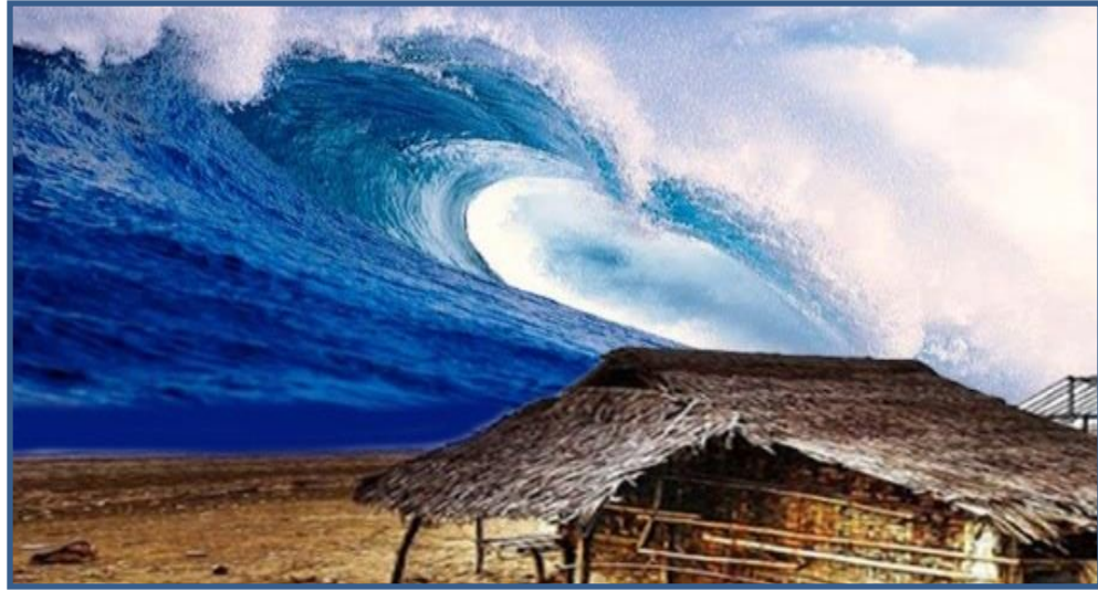
Rajah 4 Kalau kutakut dilambung ombak, tak ku berumah di tepi pantai

Leksikal dilambung merujuk kepada satu pergerakan. Dalam data di atas, leksikal dilambung dikonsepsikan kepada interaksi yang konkrit iaitu tak ku berumah di tepi pantai . Daya sumber diwakili oleh ungkapan kalau ku takut dilambung ombak , manakala elemen sasaran merujuk kepada tak ku berumah di tepi pantai . Leksikal dilambung merupakan suatu daya pergerakan naik atau dibuang ke atas tinggi-tinggi. Data ini membawa maksud seseorang yang takut berhadapan dengan penderitaan, tidak akan melakukan sesuatu yang boleh mendatangkan kesusahan kepada diri sendiri melainkan perkara tersebut telah difikirkan terlebih dahulu.