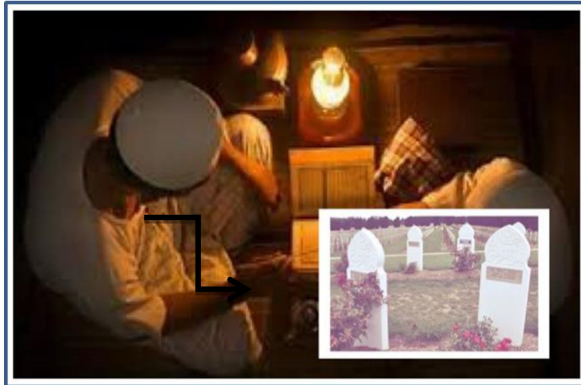
Rajah 6 Hidup di dunia buat amalan, untuk bekalan akhirat nanti

Hidup di dunia buat amalan, untuk bekalan akhirat nanti.