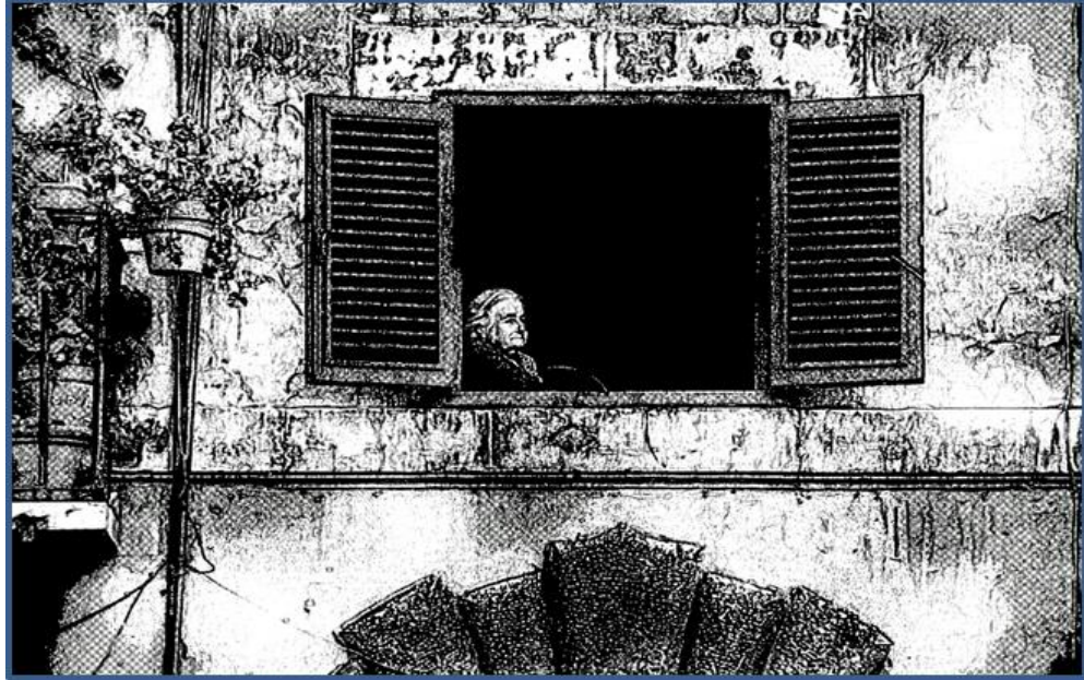
Rajah 1 Rindu di hati datang melanda, air mata jatuh ke pipi