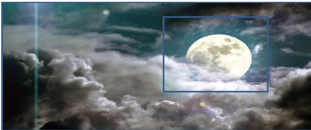
Rajah 5 Cantik bulan di kaki awan, memancar-mancar mengeluarkan cahaya

Skema imej pusat-pinggiran melibatkan maklumat teras dan pinggiran. Ia juga bersifat abstrak atau konkrit. Misalnya, dalam ruang lingkup persepsi seseorang individu atau persekitaran sosial. Skema imej pusat pinggiran dapat dikonsepsikan melalui contoh di bawah: