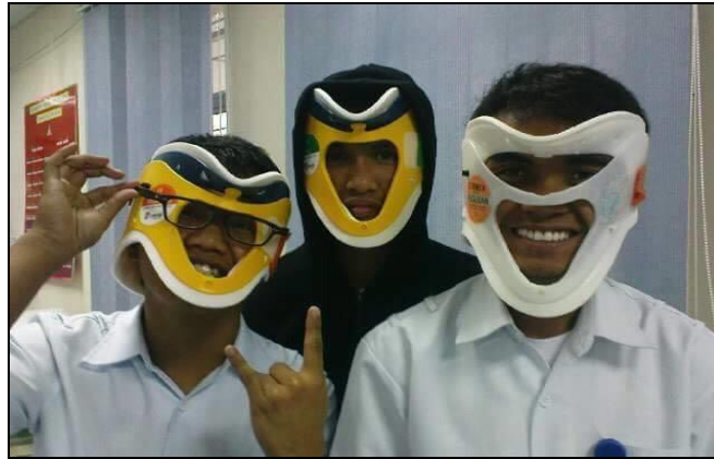
Gambar Rajah 5.3

Kerana kesilapan-kesilapan sebeginilah yang banyak mengundang perspektif negatif para penonton terhadap industri drama Melayu tempatan. Lihat sahaja seperti gambar rajah 5.3 di atas ini. Kesan daripada kesilapan yang dilakukan oleh sebuah produksi drama, maka perkara tersebut menjadi bahan jenaka oleh segelintir masyarakat yang memahami dan mengetahui amalan sebenar penggunaan alat perubatan tersebut. Situasi sebegini pastinya mengundang sesuatu perkara yang boleh menjatuhkan maruah para penerbit drama Melayu tempatan. Tanpa disedari, jika perkara sebegini dibiarkan berlarutan, pasti akan melahirkan masyarakat yang dangkal kerana hanya menerima perkara yang dipaparkan, juga masyarakat yang suka menjatuhkan industri drama kita walaupun tidak tahu punca-punca masalahnya.