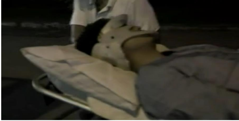
Gambar Rajah 5.1

Gambar rajah di atas merupakan antara kesilapan elemen perubatan yang sangat ketara di dalam salah sebuah drama bersiri. Pemakaian cervical collar yang sepatutnya di bahagian leher, kelihatan janggal sekali apabila dipasang dibahagian muka. Menjadi persoalan, mengapa hal sebegini boleh berlaku, kerana jika difikirkan secara logik walaupun tidak mempunyai ilmu dalam bidang perubatan, perkataan collar , atau kolar itu sendiri sudah membayangkan leher, ataupun kolar kemeja. Namun, mungkin ada masalah-masalah dalaman yang tidak dapat diketahui, seperti kekurangan dana, atau kekurangan masa untuk membuat kajian yang memungkinkan kejadian seperti ini berlaku.