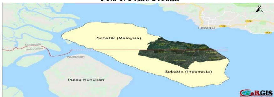
Peta 1: Pulau Sebatik