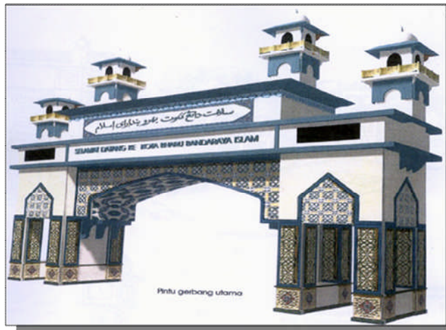
Foto 4. Gerbang ke Kota Bharu