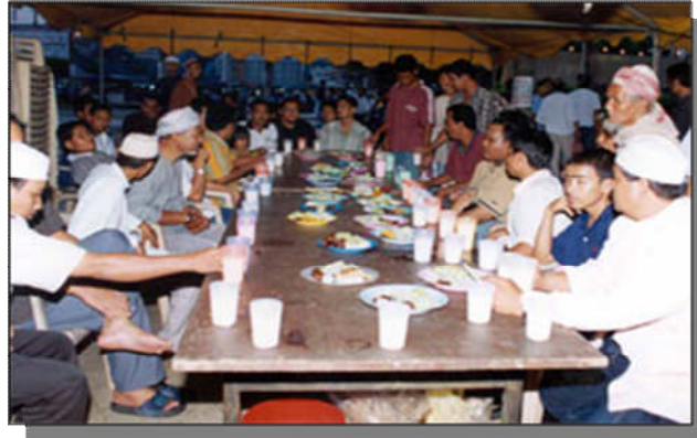
Foto 1. Program Ihya Ramadhan

MPKB-BRI merancang program keilmuan di setiap daerah sekurang-kurangnya sebulan sekali meliputi 10 daerah di bawah pentadbirannya. Antaranya: