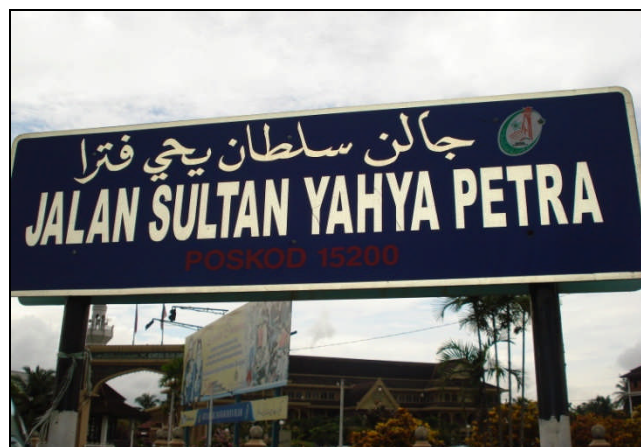
Foto 5. Papan tanda tulisan jawi