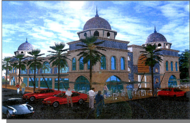
Foto 3. Islamic Bazar