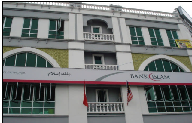
Foto 6. Bangunan moden yang turut memperlihatkan unsur-unsur senibina Islam

MPKB-BRI telah berusaha sebaik mungkin bagi memastikan perancangan bandar Kota Bharu menepati konsep perbandaran Islam dan berjaya dalam misi mereka menjadikan Kota Bharu sebuah Bandaraya Islam. Berdasarkan keempat-empat program pembangunan yang diatur itu ternyata MPKB-BRI berusaha sebaik mungkin bagi mengisi setiap program yang telah dirancang. Namun demikian, satu aspek yang penting dalam sebuah perbandaran Islam seperti pertahanan merupakan satu keterbatasan dan di luar bidang kuasa mereka. Sehingga kini peranan yang dinyatakan itu sudah cukup jelas dan asas ciri-ciri perbandaran Islam