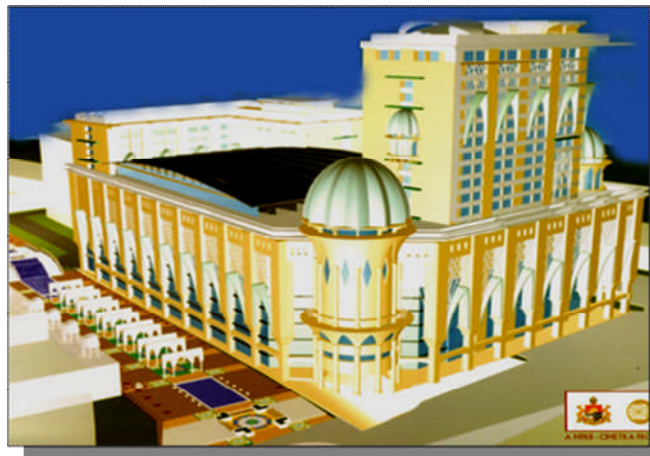
Foto 2. Kota Bharu trade centre

Bagi pembangunan fizikal, antara tumpuan yang diberikan ialah aspek lalu lintas, infrastruktur dan utiliti, kemudahan awam dan khidmat masyarakat, pengindahan kawasan, persekitaran perumahan dan kejiranan serta pelancongan dan warisan budaya (lihat lampiran 1 serta foto 1 hingga 6).