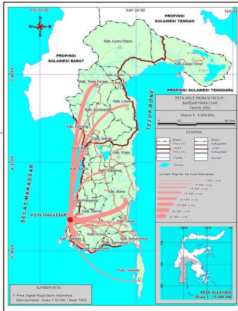
Rajah 2. Peta aliran migrasi masuk ke Bandar Makassar