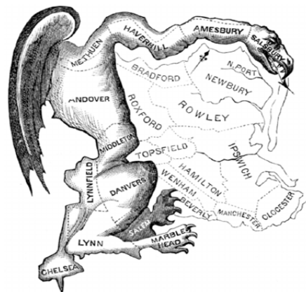
Rajah 1. Ikon popular gerimander

Terdapat banyak isu yang diperbahaskan dalam proses pilihan raya dan salah satu daripadanya adalah gerimander. Gerimander merupakan satu kaedah manipulasi untuk meraih undi melalui pemetaan pengubahan sempadan pilihan raya dalam persempadanan baru bagi konstituensi pilihan raya. Kaedah ini dikatakan akan memberi keuntungan kepada parti pemerintah untuk mendapatkan majoriti undi dalam sesuatu pilihan raya selepas persempadanan semula dibuat. Sebenarnya gerimander adalah satu frasa yang telah wujud 200 tahun dahulu iaitu pada tahun 1812 yang telah diperkenalkan oleh Gabenor Elbridge Gerry (1744-1874) sebagai satu respon ke atas persempadanan yang telah dijalankan di Massachusetts oleh parti Democratic dan Republicans . Perkataan gerimander adalah sempena nama beliau iaitu Gerry yang digabungkan dengan salamander iaitu sejenis cicak yang menyerupai bentuk daerah setelah berlakunya persempadanan tersebut. Semenjak itu terma gerimander telah digunakan secara meluas untuk menerangkan persempadanan yang dilakukan untuk mendapatkan kepentingan politik terutamanya undi serta telah menjadi ikon popular dalam perbahasannya (Rajah 1). Gerimander telah berlaku di Malaysia dan sebahagiannya memberi kesan kepada keputusan pilihan raya yang boleh menjadi kanser dalam proses pilihan raya.