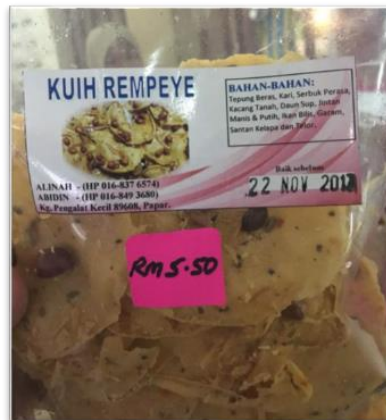
Foto 1. Pembungkusan kuih tradisional bagi usahawan tahap rendah