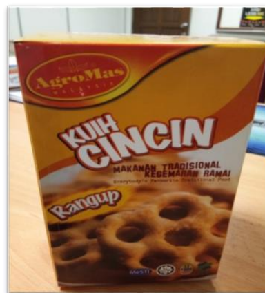
Foto 2. Pembungkusan kuih tradisional bagi usahawan tahap tinggi