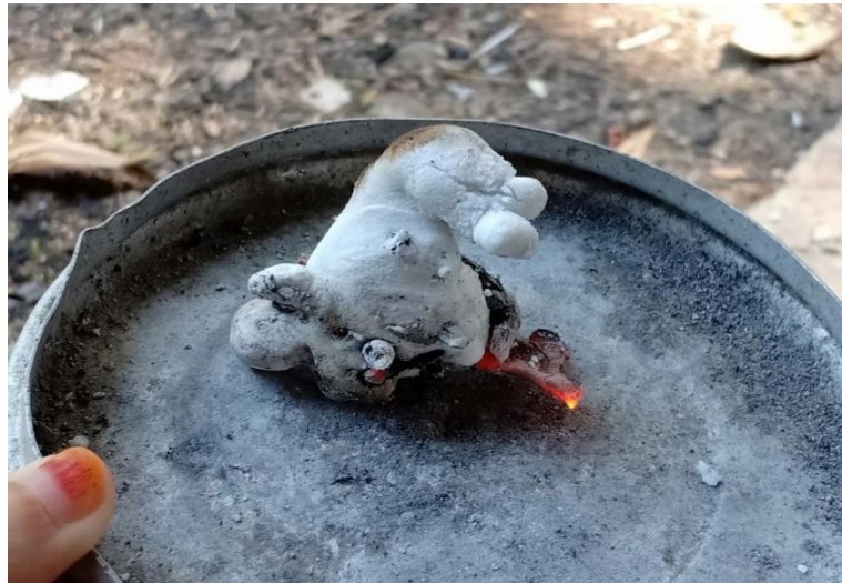
Rajah 4. Tawas yang siap dibakar di atas bara api.

sehinggakan mudah untuk diramas menjadi butiran debu yang halus. Tawas yang telah siap dibakar akan diambil oleh Puan Hawa untuk dikenal pasti bentuk yang terhasil bagi mengetahui punca penyakit yang dialami oleh pesakit. Setelah dikenal pasti, tawas yang telah siap dibakar ini akan disejukkan seketika untuk diramas bersama air dan diberikan kepada pesakit (Rajah 4).