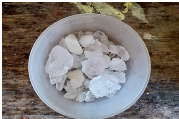
Rajah 2. Tawas yang telah dipecahkan menjadi bahagian yang lebih kecil.

Tawas yang digunakan oleh Puan Hawa hanyalah tawas yang dibeli di kedai berhampiran dengan pekan kecil Sungai Mati. Tawas tersebut akan dipotong kepada beberapa bahagian yang kecil bagi memudahkan proses pembakaran tawas di atas bara api (Rajah 2). Tawas yang dibakar itu hanya merupakan perantaraan beliau untuk mengetahui kesahihan punca penyakit yang diceritakan oleh pesakitnya. Tidak semua ciri sakit yang dialami oleh pesakit berpunca daripada gangguan makhluk halus. Terdapat kemungkinan juga penyakit tersebut merupakan sejenis pembawaan daripada persekitaran pesakit. Dengan kata lain, penyakit tersebut merupakan pembawaan daripada individu lain yang mengganggu semangat atau jiwa pesakit sehingga membuatnya jatuh sakit tanpa menyedari punca kepada penyakitnya.