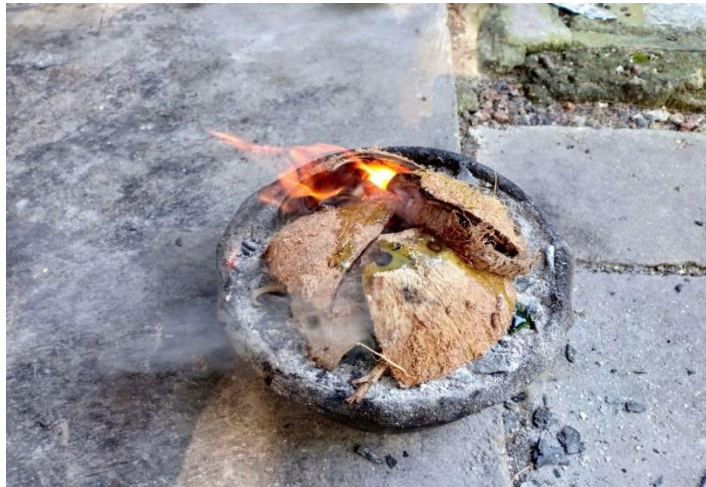
Rajah 3. Pembakaran tempurung kelapa bersama ranting kayu yang telah diembunkan sehari semalam.

Empat barang diperlukan dalam proses pembakaran tawas iaitu tempurung kelapa, ranting kayu yang telah diembunkan sehari semalam, bekas berupa periuk yang diletakkan dengan arang di bawahnya dan tawas yang telah dibahagikan kepada bahagian yang lebih kecil. Pembakaran tawas ini memerlukan masa antara 10 hingga 18 minit. Tempurung kelapa dan ranting kayu yang telah diembunkan sehari semalam akan dibakar sehingga menjadi bara. Tawas tidak akan dibakar sehingga dua komponen tersebut benar-benar sempurna menjadi bara api. Tempurung kelapa dan ranting merupakan bahan yang wajib dalam pembakaran tawas (Rajah 3).