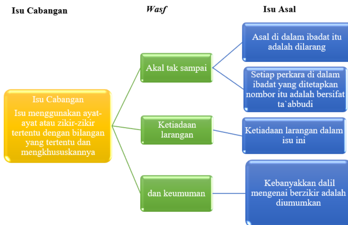
RAJAH 2. Pecahan isu cabang menggunakan ayat-ayat atau zikir-zikir tertentu dengan bilangan yang tertentu dan mengkhususkannya dan persamaannya dengan isu-isu asal.