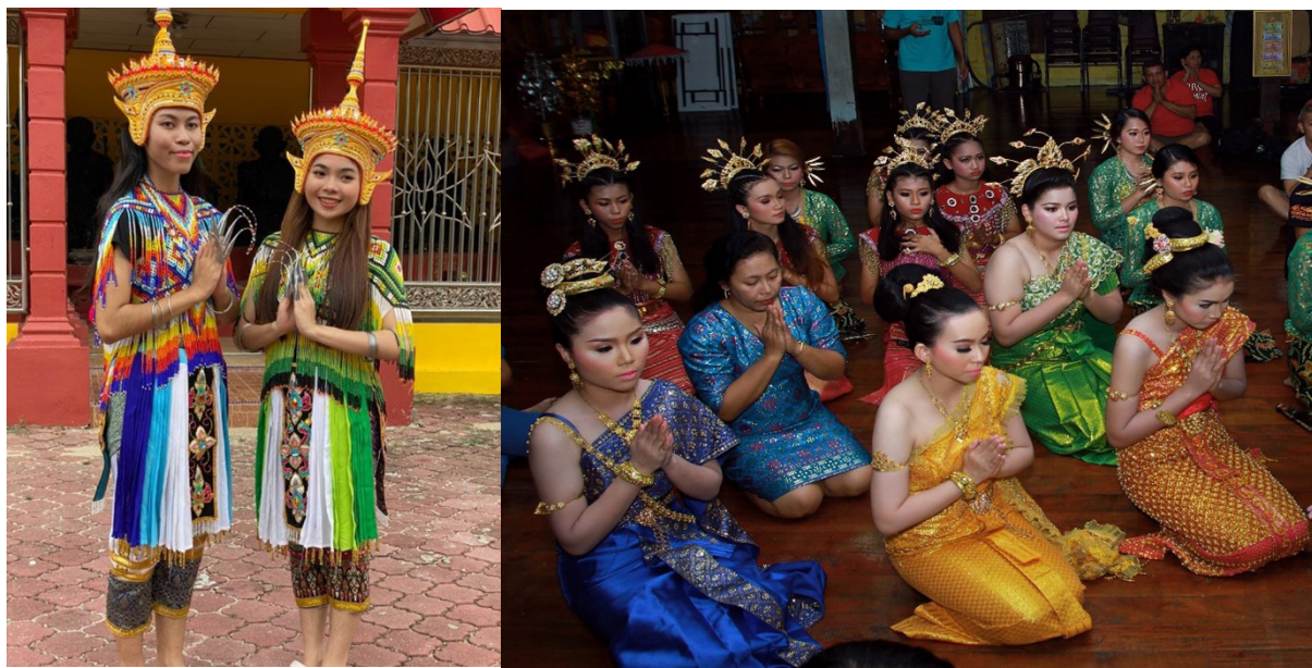
FOTO 3. Pakaian kesenian masyarakat Siam

tahun baharu masyarakat Siam yang disambut pada April setiap tahun bagi menghormati ibu bapa. Perayaan ini lebih kurang sama dengan perayaan lain yang mana semua ahli keluarga perlu balik menemui ibu bapa mereka. Pada pagi perayaan, anak-anak akan menziarahi kubur dan selepas itu mereka akan balik untuk memandikan ibu bapa mereka. Hari Wesak adalah hari bagi memperingati hari lahir Buddha. Manakala Loikratong atau dikenali sebagai “kartina” adalah masa untuk orang Siam melepaskan hajat masing-masing dengan cara menghanyutkan barang-barang ke sungai. Ia disambut pada setiap bulan November setiap tahun.