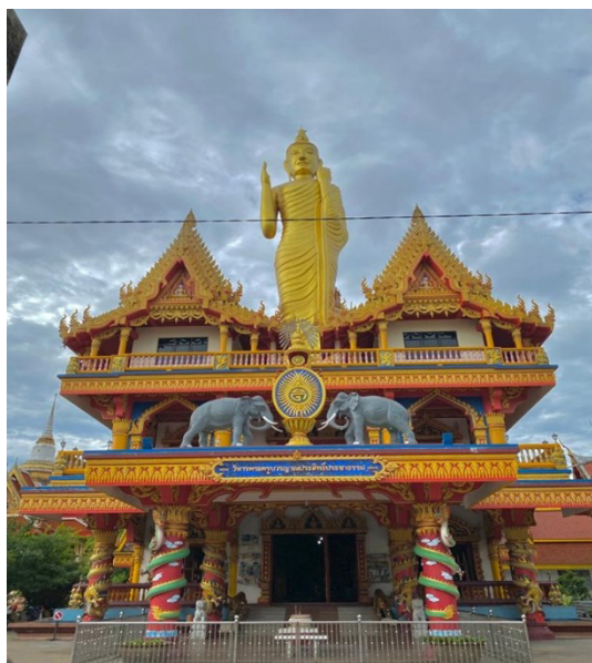
FOTO 6. Imej Buddha Wat Chonprachumthat Chanaram, Tumpat