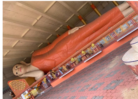
FOTO 5. Imej Buddha Tidur di Wat Pothivihan, Tumpat