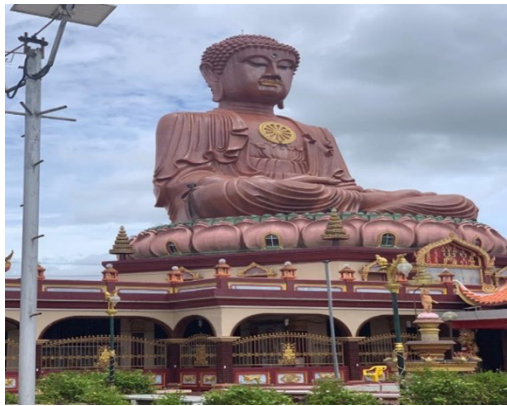
FOTO 4. Imej Buddha di Wat Machimmaram di Tumpat