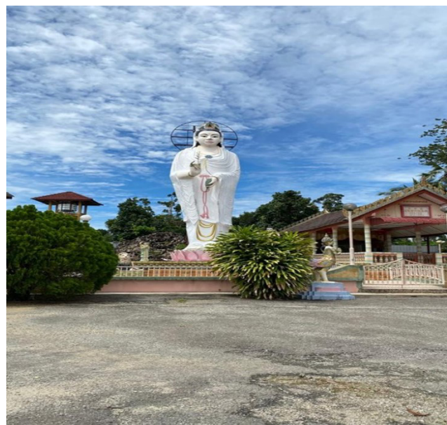
FOTO 7. Imej Buddha di Wat Prachumthat Canaram, Tumpat