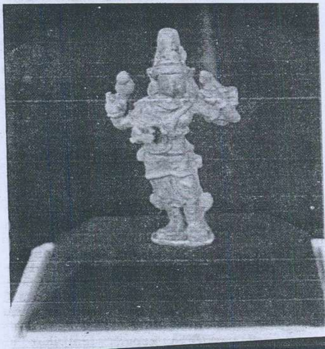
Gambar 6. Arca gangsa dewa, Bodhisattva yang sedang berdiri

Langgam yang dipengaruhi oleh India Selatan dapat dilihat lagi pada arca gangsa bodhisattva yang sedang berdiri (Gambar 6). Dewa ini mungkin Avalokitesvara berdasarkan kepada padma