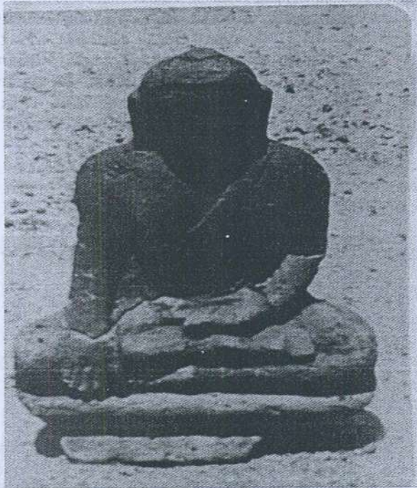
Gambar 5. Arca Buddha sedang duduk, Pengkalan Bujang, Kedah.

arca-arca itu yang telah rosak maka agak susah hendak menentukan umurnya. Berdasarkan kepada langgam sebuah daripada arca-arca Buddha yang sedang duduk (gambar 5) maka dapat dinyatakan bahawa langgamnya mirip kepada langgam zaman Cola pada abad ke 10 atau awal abad ke 11 Masihi.