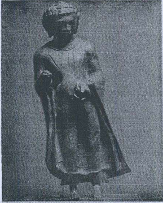
Gambar 2. Arca Buddha dari Pengkalen, Perak.

Ciri yang menarik tentang arca ini ialah tentang langgam uttarasanga yang diasaskan kepada sejarah seni Gandhara iaitu uttarasanga menutup seluruh badan dengan infleksi circumflex . Di atas uttarasanga kelihatan calar-calar yang menggariskan tanda kedut. Arah garis itu adalah keterangan utama yang dapat dikaitkan dengan pengaruh Ghandara . Tetapi garisan ini tidak banyak seperti yang biasa terdapat pada uttarasanga arca Buddha langgam Ghandhara 11 .