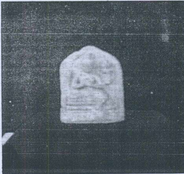
Gambar 7. Arca Avalokitesvara dari Lembah Bujang, Kedah.

Arca Avalokitesvara sedang duduk yang dibuat dari tanah liat (Gambar 7) tidak dapat dipastikan pengaruh langgamnya yang sebenar kerana saiznya terlalu kecil. Ini mengingatkan kita kepada beberapa buah arca agama Buddha dibuat dari tanah liat yang dijumpai di Gua Kurong Batang di Perlis 31 . Arca-arca itu dikelaskan sebagai Mahayana Votive Tablets juga diterima sebagai hasil ciptaan ahli-ahli seni agama Buddha tempatan pada abad ke 9 atau 10 Masihi. Tarikh itu diberi setelah dibandingkan dengan tarikh-tarikh arca-arca jenis itu oleh Coedes yang dijumpai di beberapa tempat di Selatan Thailand 32 . Kemungkinan juga arca dari Kampung Pengkalan Bujang itu mempunyai tarikh yang sama memandangkan arca-arca yang lain dari Tapak 21/22 itu mempunyai langgam Cola abad ke 10/11 itu.