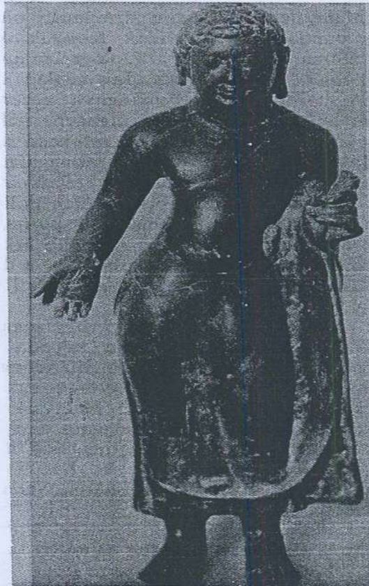
Gambar 1. Arca Buddha dari Tapak 16A, Lembah Bujang.

Teknik menggambarkan arca Buddha yang sedang berdiri memakai uttarasanga yang tidak berkedut mestilah dipengaruhi