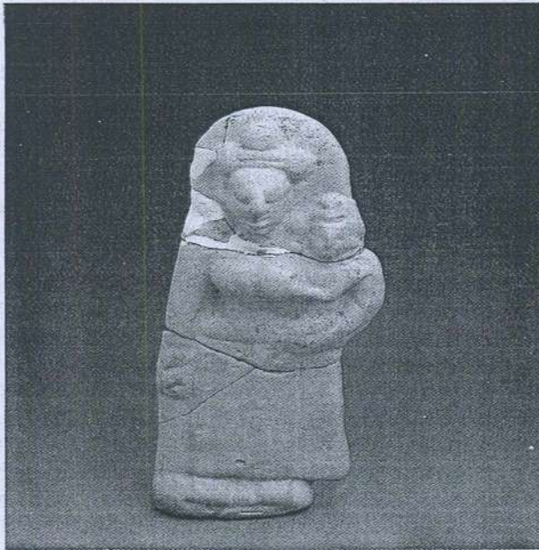
Gambar 8. Arca Hariti Sungai Mas.

Oleh kerana umur arca Hariti dari Peshwar itu lebih tua dari arca dari Candi Mendut maka arca Hariti Sungai Mas adalah lebih tua dari arca Hariti Candi Mendut. Berapa lama lebih tua itu tidak dapat dipastikan dengan tepat. Namun demikian berdasarkan kepada langgamnya yang hampir dengan arca dari Muzium Peshwar dan dengan arca-arca dari zaman Dvaravati maka kemungkinan besar ianya dicipta oleh ahli seni agama tempatan pada abad ke 6 atau 7 Masihi.