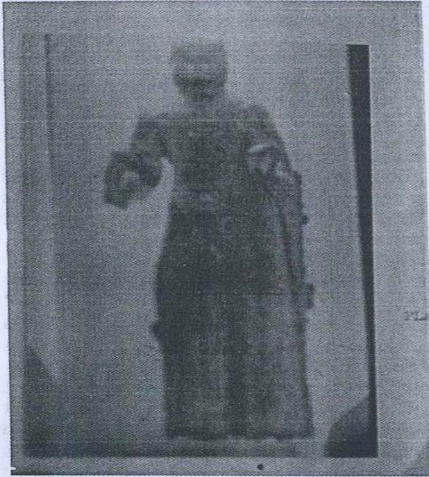
Gambar 3. Arca Buddha dari Lembah Kinta, Perak.

langgam Gupta sekolah Sarnath iaitu arca itu memakai jubah tanpa tanda lipatan. Tetapi seperti juga arca (Gambar 1), arca ini memakai jubah yang menampakkan bahu sebelah kanan.