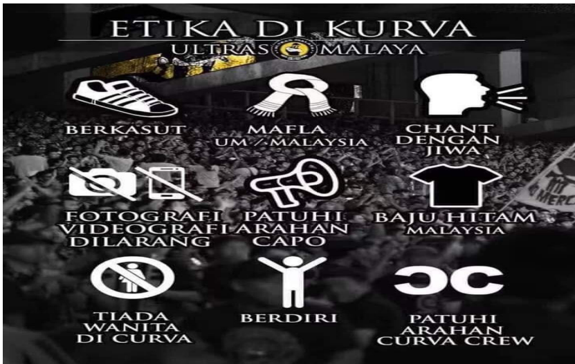
Gambar 1: Etika di curva Ultras Malaysia